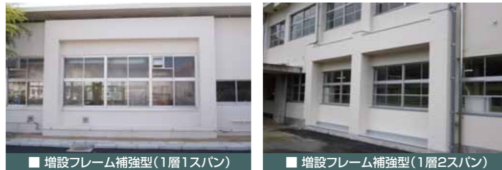
■ 増設フレーム補強型(1層1スパン)